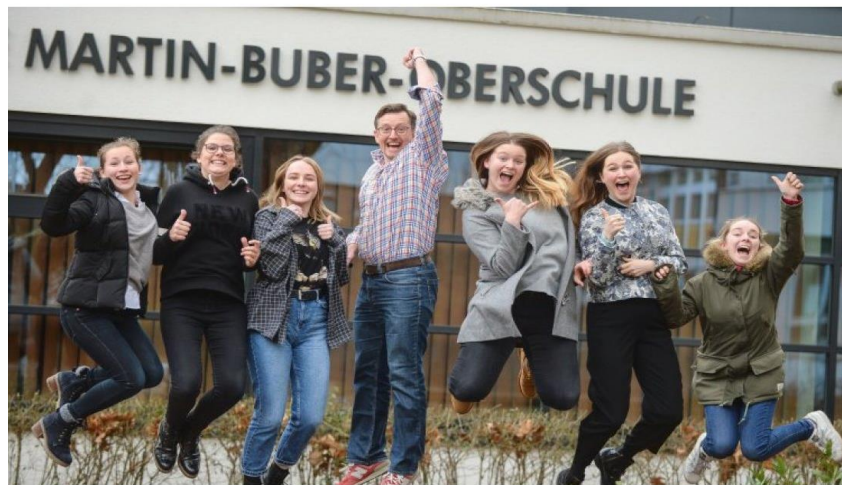
er Martin-Buber-Oberschule in Spandau gab es berlinweit die meisten Anmeldungen